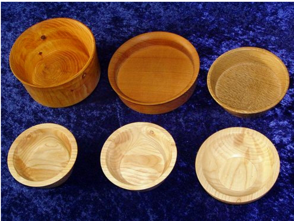
Hohlgefäße verschiedener Epochen in Douglasie, Kirsche, Eiche und Esche.

Mit meiner Bemerkung, daß alle benötigten und nicht benötigten Schalen, Schüsseln und Näpfe auf dieser Welt bereits gedrechselt seien, habe ich mir vereinzelt Feinde für's Leben geschaffen... ;-)