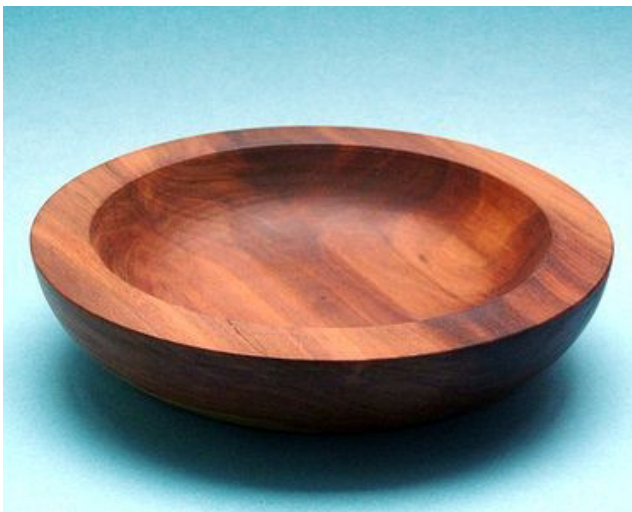
Pflaume, 17,5 x 4,5 cm