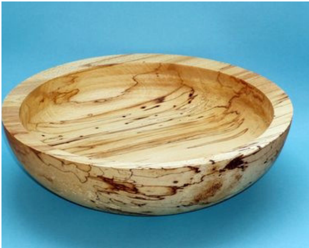
Buche, gestockt, 35 x 10,5 cm