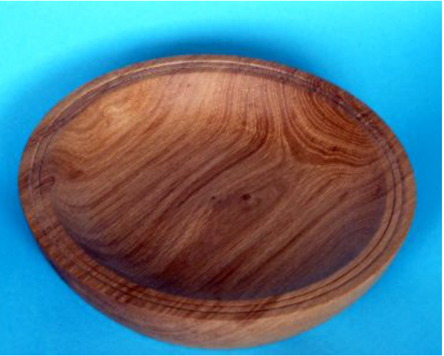
Eiche 27,5 x 6 cm