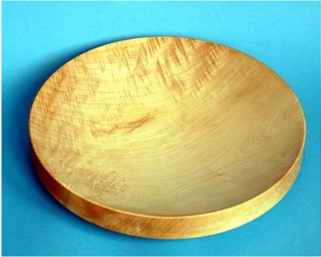
Esche 29,5 x 6 cm