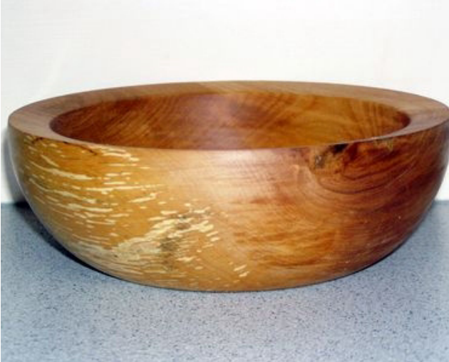
20,5 cm x 7 cm