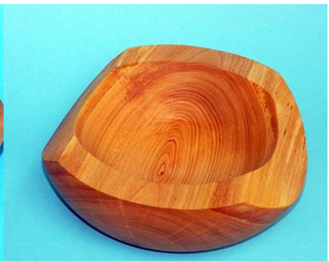
Esche 23 x 7,5 cm