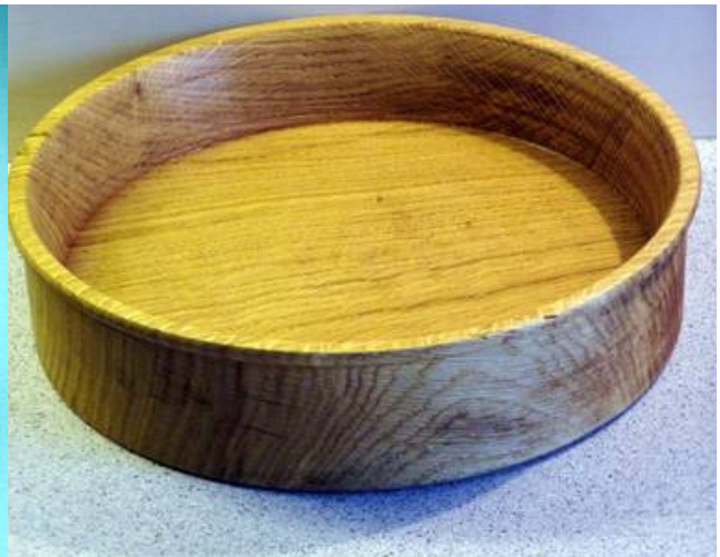
Eiche, 25 x 6 cm