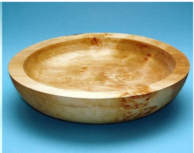
Erle 29 x 7 cm