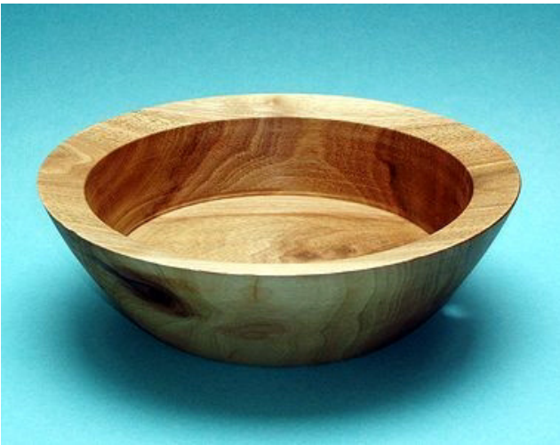
Nussbaum mit Astloch, 20,5 cm x 6,5 cm