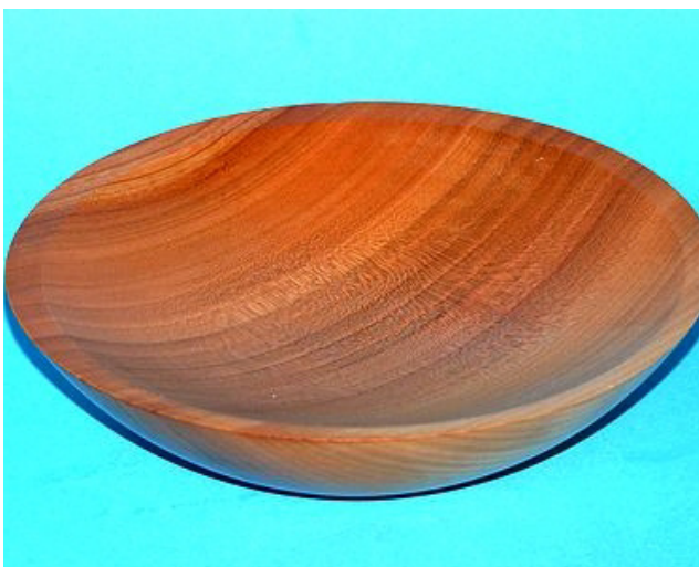
Kirsche 20 x 5 cm