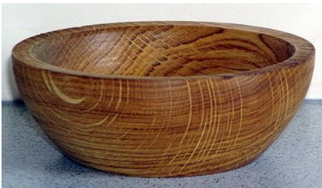
Eiche, 14 x 5 cm