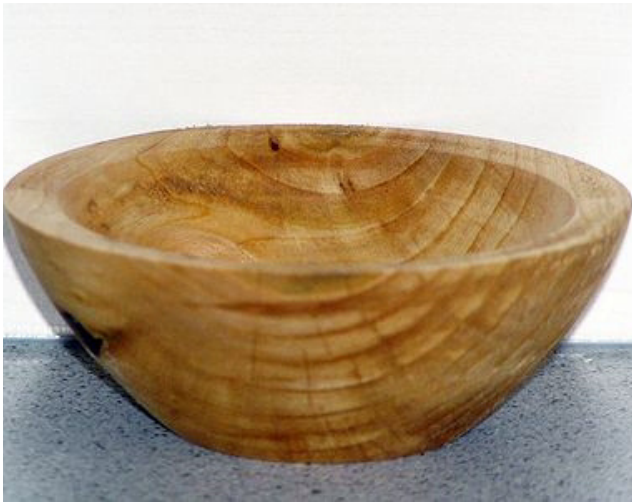
Kirsche, 10 x 4 cm