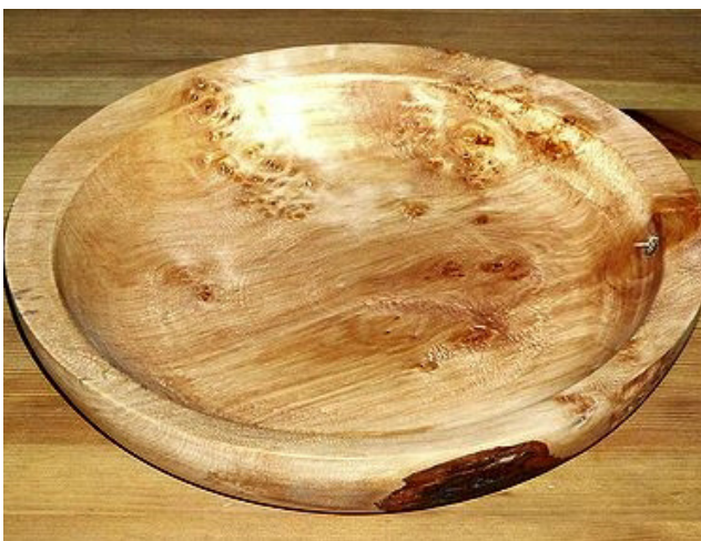
Erle 30,5 x 6 cm