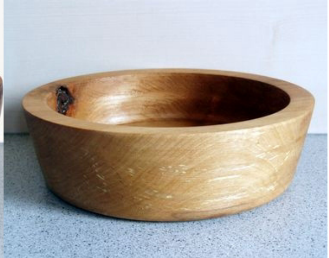
20 cm x 6 cm