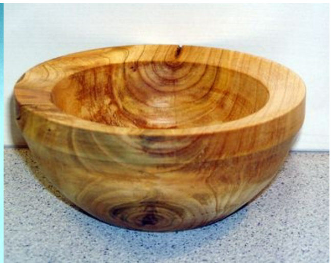
Wildkirsche, 13 x 6 cm