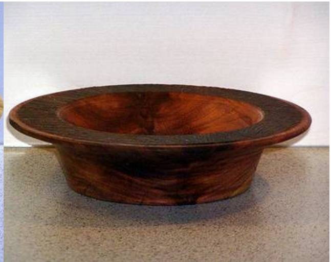
Zwetschge, 18 x 4 cm