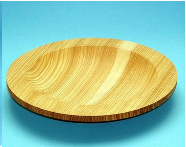
Esche 30 x 4,5 cm