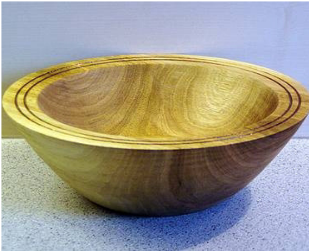
Nussbaum, 18,5 x 6 cm