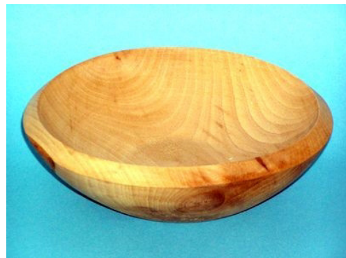
Buche, 23,5 x 7,5 cm