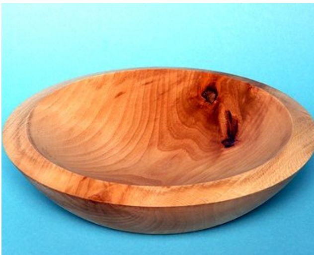
Platane 23 x 7 cm