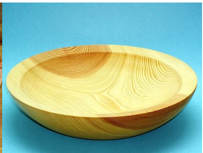
Kiefer, 27,5 x 6 cm