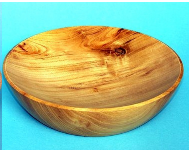
Robinie 18 x 5 cm